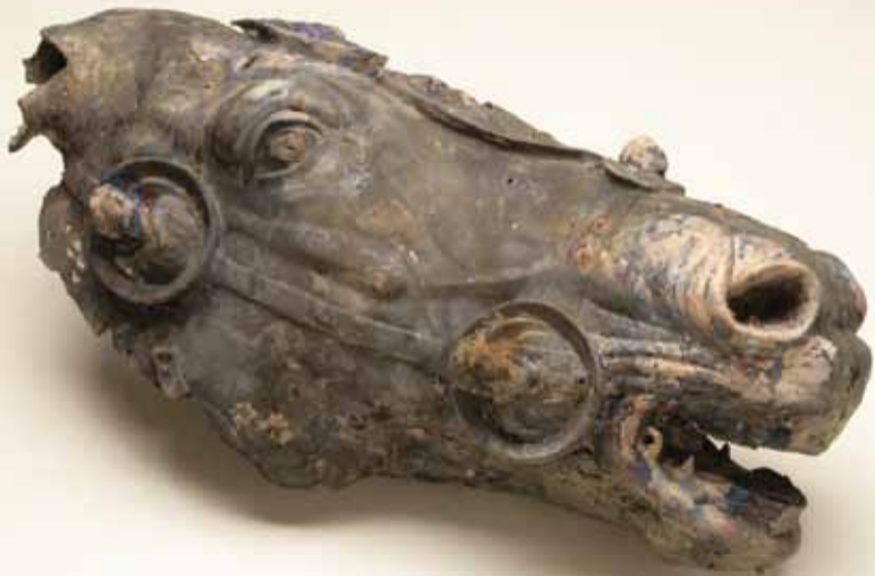
Kopf des Pferdes einer vergoldeten lebensgroßen Reiterstatue, Waldgirmes, Lahn-Dill-Kreis

1902 wurde die Kommission beim Institut mit eigener Satzung gegründet. Sie hat die Aufgabe, Vor- und Frühgeschichtsforschung zu betreiben, zu fördern und zu veröffentlichen, vornehmlich in Alteuropa von den ältesten Perioden bis zum frühen Mittelalter. Dabei arbeitet sie eng mit Universitäten, Museen und Denkmalämtern zusammen und unterhält rege Kontakte zu entsprechenden Fachinstitutionen des Auslandes. Sie unterhält die umfangreichste Fachbibliothek zur Ur- und Frühgeschichte in Europa, in der in- und ausländische Gäste forschen.