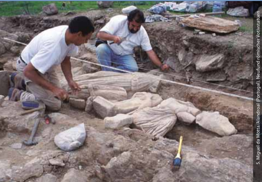
S. Miguel da Motta/Alandroal (Portugal). Neufund römischer Votivstatuen

Seit dem Jahre 2009 ist die Forschungsstelle Lissabon des DAI in den Räumlichkeiten des IGESPAR (Portugiesisches Amt für Architektur und Bodendenkmalpflege) eingerichtet. Das entsprechende Memorandum sieht vor, dass im Gegenzug portugiesischen Archäologen jährlich ein Stipendium beim DAI eingeräumt wird. Die Forschungsstelle setzt eine Tradition der Präsenz des DAI in Portugal fort, die bereits von 1971 bis 1999 als Außenstelle der Abteilung Madrid bestanden hatte.