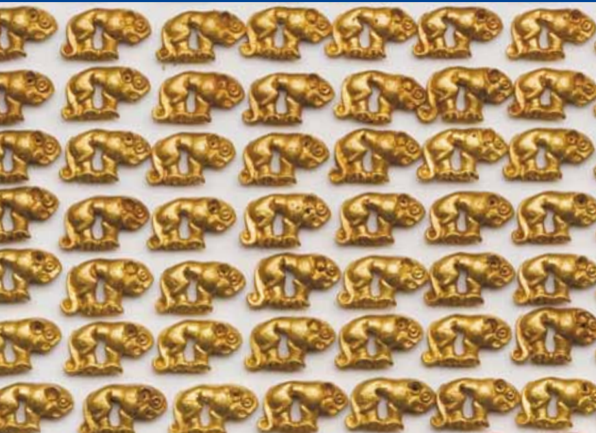
Skythischer Fürstengrabhügel Aržan, Tuva, Russische Föderation. Auf die Kleidung aufgenähte Pantherfiguren aus Gold.

Die Eurasien-Abteilung wurde 1995 gegründet. Die Abteilung widmet sich der Erforschung der Wechselwirkungen zwischen den nomadischen und sesshaften Kulturen des eurasischen Steppenraumes und der südlich angrenzenden Gebiete von der Vorgeschichte bis ins Mittelalter. Das Arbeitsgebiet umfasst die Russische Föderation, die Ukraine und Moldova, Georgien, Aserbajdschan und Armenien, die mittelasiatischen Republiken Kasachstan, Usbekistan, Tadschikistan, Kirgistan und Turkmenistan, Iran, Afghanistan, Pakistan, die Mongolei und China.