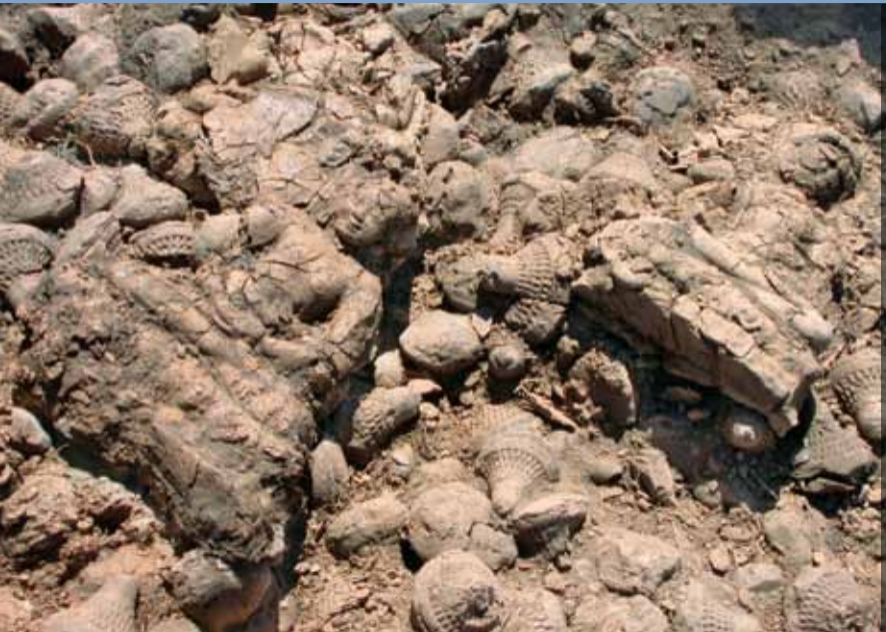
Kleinplastik aus Ton, Bodhisattvas des 13./14. Jh. aus Karakorum

Auf Anregung der Mongolischen Akademie sowie auf Initiative der KAAK wurde 2005 beschlossen, in Ulaanbaatar eine Forschungsstelle einzurichten. Dank der großzügigen Unterstützung der Theodor-Wiegand-Gesellschaft e.V. konnte 2007 eine Wohnung unweit des Archäologischen Instituts erworben und die Forschungsstelle in Anwesenheit des Präsidenten der Mongolischen Akademie sowie des deutschen Botschafters feierlich eröffnet werden.