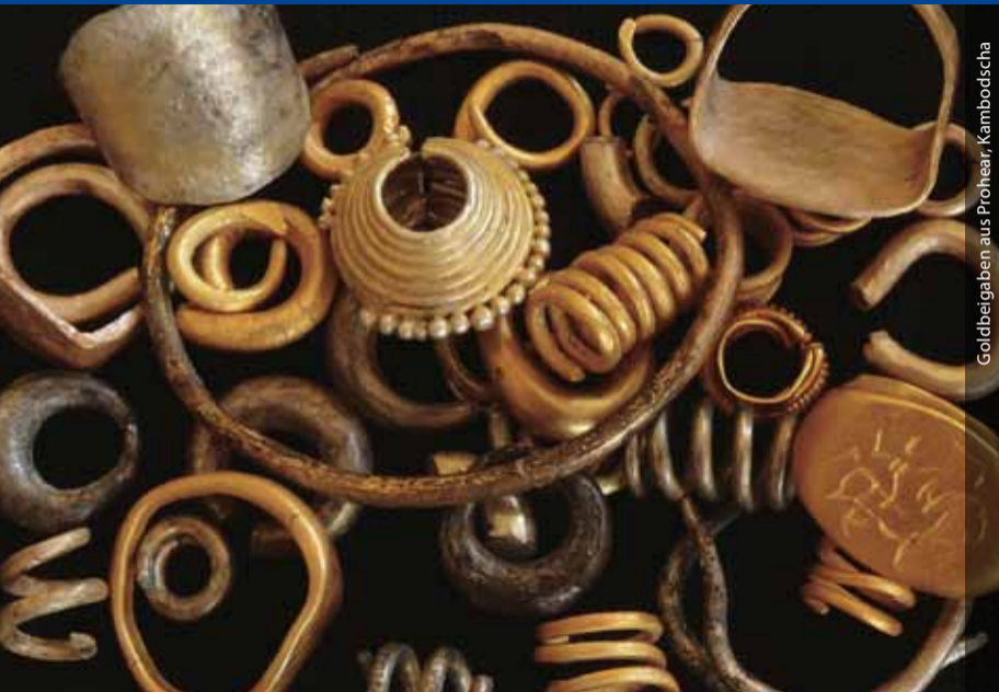
Goldbeigaben aus Prohear, Kambodscha

Die Kommission wurde anlässlich des 150jährigen Bestehens des Instituts im Jahre 1979 gegründet. Sie unternimmt archäologische Forschungen in Amerika, Afrika, Asien und Ozeanien. Ihr wissenschaftlicher Auftrag ist es, archäologische Beiträge zu der außerhalb Europas und der Alten Welt ganz andersartig verlaufenen Menschheitsgeschichte zu leisten. In jüngster Zeit trägt sie im Rahmen übergreifender Fragestellungen zur Grundlagenforschung bei.