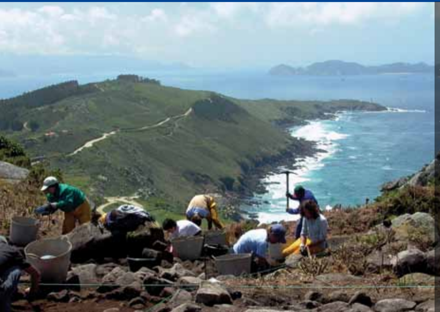
Monte do Facho/Cangas do Morrazo, Galicien, Spanien

Die 1943 gegründete Abteilung Madrid befindet sich seit 1954 in einer im Bauhausstil errichteten Wohnanlage am nördlichen Rand des Zentrums von Madrid, seit 1983 in drei Häusern. Arbeitsbereich ist die Archäologie der Iberischen Halbinsel sowie Marokkos von der Vorgeschichte bis ins frühe Mittelalter.