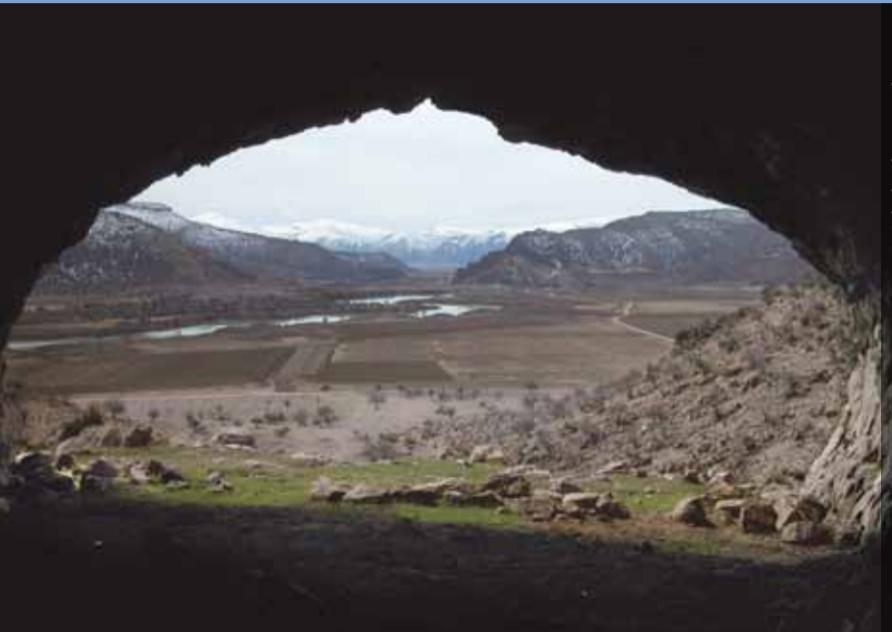
Darre-ye Bolaghi, Ebene vor Flutung

Die 1961 gegründete Abteilung Teheran wurde 1996 als Außenstelle der Eurasien-Abteilung zugeordnet. Bis 1979 wurden von Teheran aus Ausgrabungen in dem sassanidischen Heiligtum Takht-i Suleiman und in der urartäischen Burg Bastam betreut. Heute verfügt die Außenstelle über eine Fachbibliothek mit über 10.000 Bänden, sowie ein Fotoarchiv in Berlin. Die Feldforschungen orientieren sich mit Untersuchungen zu Rohstoffnutzung und Innovationen am DAI Forschungscluster 2, und unterstützen zugleich die Arbeit der Iranischen Kulturerbebehörde durch Kooperationen bei Rettungsgrabungen in Stauseegebiet. Ein weiterer Schwerpunkt liegt auf der Ausbildung junger Wissenschaftler im Iran und der Betreuung iranischer Doktoranden in Deutschland.