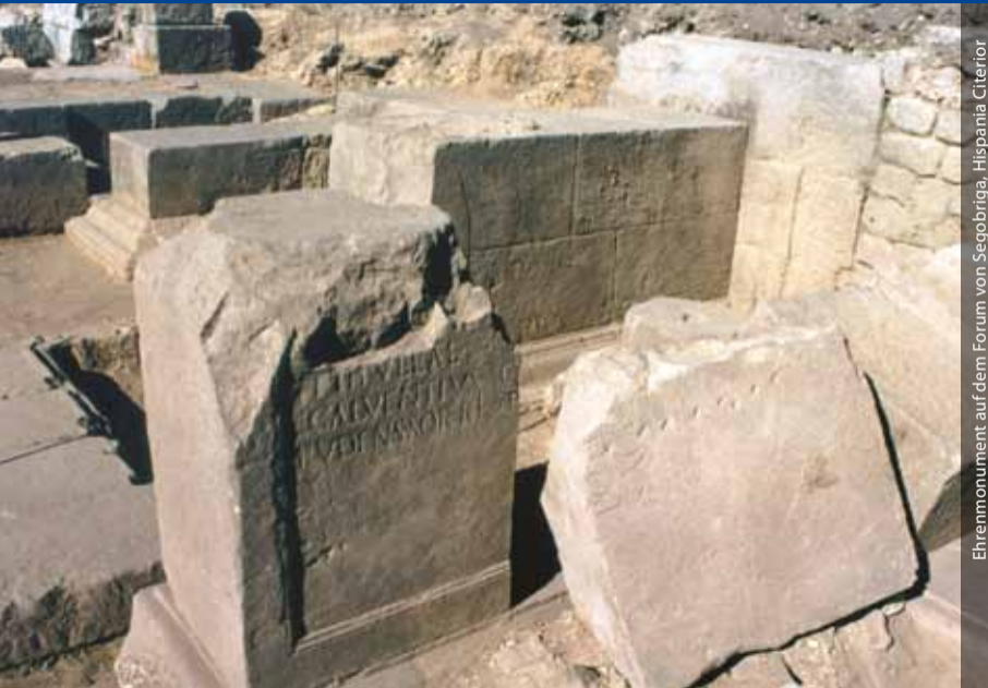
Ehrenmonument auf dem Forum von Segobriga, Hispania Citerior

Die Kommission mit eigener Satzung und eigenem wissenschaftlichen Beirat wurde 1951 in München gegründet und 1967 in das Deutsche Archäologische Institut integriert. Arbeitsbereich ist die gesamte Alte Geschichte, insbesondere in ihrer Verbindung mit der Archäologie. Arbeitsschwerpunkte liegen in der Epigraphik, Numismatik, Papyrologie und historischen Topographie. Mit dem von der Gerda Henkel Stiftung geförderten Jacobi-Stipendium ermöglicht die Kommission Doktorandinnen und Doktoranden der Alten Geschichte Forschungsaufenthalte an ihrer Bibliothek.