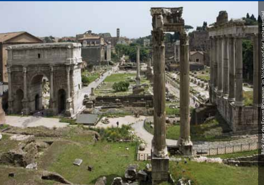
Blick über das Forum Romanum, im Vordergrund der Jupitertempel

Die Abteilung Rom ging aus dem 1829 gegründeten Instituto di Corrispondenza Archeologica hervor und bildet damit die Keimzelle des Deutschen Archäologischen Institutes. Sie besitzt eine altertumswissenschaftliche Bibliothek von weltweit zentraler Bedeutung, eine der größten spezialisierten Fotosammlungen Italiens sowie ausgedehnte Archive. Durch diese Forschungsinstrumente, zahlreiche Veranstaltungen und Publikationen ist das Institut auch international eines der bedeutendsten Zentren innerhalb der Erforschung antiker Kulturen.