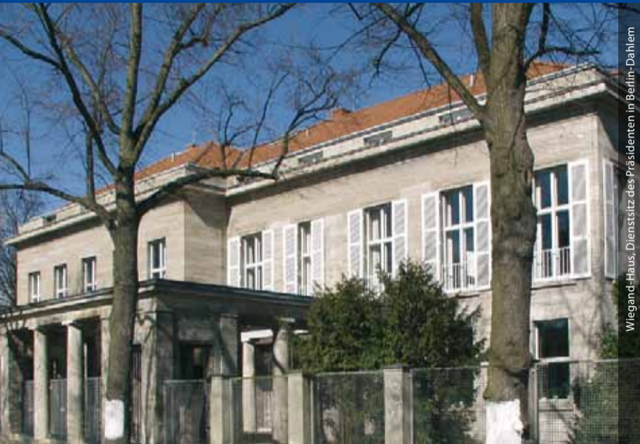
Wiegand-Haus, Dienstsitz des Präsidenten in Berlin-Dahlem

In Berlin befinden sich seit 1833 der Dienstsitz des Präsidenten und die Verwaltung des Gesamtinstituts. Weitere Bereiche sind die Redaktion zur Bearbeitung der von der Zentrale herausgegebenen Publikationen, das IT-Referat zur technischen Versorgung aller Zweiganstalten des DAI sowie konzeptionellen Planung in Hinsicht auf die langfristige Sicherung und Interoperabilität von Forschungsdaten des DAI, das Architekturreferat für Aufgaben der Bauforschung und das naturwissenschaftliche Referat mit den Arbeitsbereichen Archäozoologie, Anthropologie, Archäobotanik und Dendrochronologie. Das Forschungsspektrum an der Zentrale beinhaltet Themen aus dem gesamten Arbeitsbereich des Instituts.