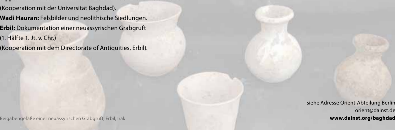
Beigabengefäße einer neuassyrischen Grabgruft, Erbil, Irak

siehe Adresse Orient-Abteilung Berlin orient@dainst.de www.dainst.org/baghdad