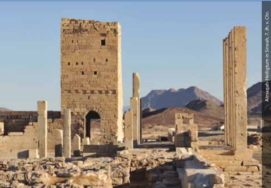
Almaqah-Helligtum in Sirwah, 7. Jh. v. Chr.

Die Außenstelle Sanaa ging 1978 aus der Jemen-Expedition des DAI hervor und ist seit 1996 organisatorisch der Orient-Abteilung angegliedert. Das Arbeitsgebiet umfasst die archäologische, baugeschichtliche, philologische und kunsthistorische Erforschung Südarabiens von den Anfängen bis in die islamische Zeit. Seit 2009 bilden zudem Kulturkontakte zwischen Südarabien und Äthiopien einen weiteren Forschungsschwerpunkt. Darüber hinaus ist die Außenstelle in kulturpolitische Projekte im Jemen und Äthiopien involviert, die den Erhalt und die touristische Erschließung des kulturellen Erbes zum Ziel haben.