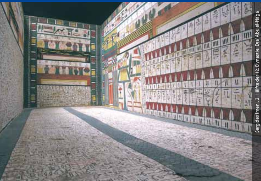
Sarg des Imeni, 2. Hälfte der 12. Dynastie, Dra' Abu el-Naga

Das „Kaiserlich Deutsche Institut für Ägyptische Altertumskunde“ wurde 1907 gegründet und ist seit 1929 dem DAI angegliedert. Es unterhält die zweitgrößte einschlägige Fachbibliothek des Landes, die allen Wissenschaftlern offensteht. Die Abteilung erforscht in Kooperation mit dem ägyptischen Antikendienst sowie internationalen Partnern alle Epochen Ägyptens von der Vorgeschichte bis zur Moderne. Die Abteilung verfolgt dabei fünf Leitfragen: · Siedlungs- und Landschaftsgeschichte · Räume und Rituale: Gestaltung und Funktion · Lebenswelten und Handlungskompetenz · Kontinuität, Transformation und Innovation · Die Ägyptenrezeption und ihre Bedeutung für die Identitätsbildung in Ägypten und Europa.