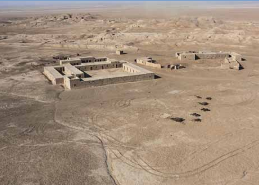
Uruk-Warka, Zentrum der Stadt (Foto 2008)

1955 eröffnete das DAI eine Abteilung in Baghdad und bot damit den seit 1887 laufenden deutschen Ausgrabungen im Irak eine institutionelle Basis. Seit 1996 gehört sie als Außenstelle der neu gegründeten Orient-Abteilung an. Ihr Arbeitsbereich umfasst die Kulturen Mesopotamiens von der Vorgeschichte bis zum islamischen Mittelalter.