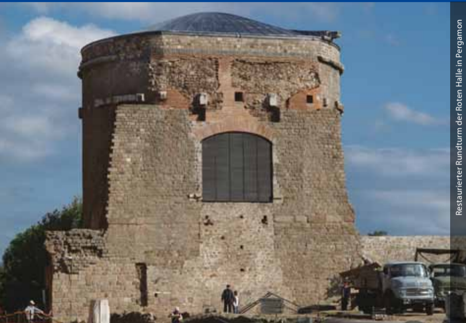
Restaurierter Rundturm der Roten Halle in Pergamon

Die Abteilung Istanbul wurde 1929 zum 100jährigen Jubiläum des DAI gegründet. Sie ist seit 1989 in einem Teil des Gebäudes der ehemaligen Deutschen Botschaft untergebracht. Die Aufgaben der Abteilung umfassen Forschungen von der Urgeschichte Anatoliens und Thraikiens bis zur osmanischen Epoche.