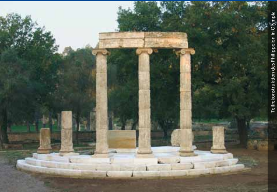
Teilerrekonstruktion des Philippeion in Olympia

Die 1874 gegründete Abteilung ist im Zentrum Athens in einem Haus untergebracht, das Heinrich Schliemann von den Architekten Wilhelm Dörpfeld und Ernst Ziller im klassizistischen Stil errichten ließ. Die Abteilung unterhält eine bedeutende Bibliothek und eine umfangreiche Fotothek, deren Anfänge bis in die Zeit ihrer Gründung zurückreichen.