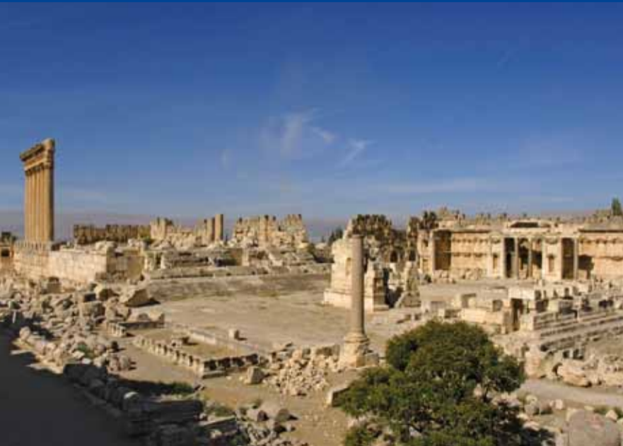
Römisches Jupiter-Heiligtum, Baalbek, Libanon

Seit 1996 sind die archäologischen Forschungen des Instituts im Vorderen Orient in der Orient-Abteilung zusammengefasst, die ihren Sitz in Berlin hat. Außenstellen gibt es in Bagdad, Sanaa und Damaskus. Erforscht werden kulturgeschichtlich bedeutende Orte und Landschaften des Vorderen Orients, seien es prähistorische Siedlungsplätze und Heiligtümer, Zentren früher mesopotamischer Hochkulturen, Oasen und Karawanenstationen an der Weihrauchstraße und ihr Hinterland, Städte der hellenistisch-römischen Zeit oder Siedlungen und Bauwerke aus spätantiken und islamischen Perioden.