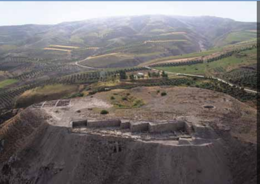
Der Tall Zirā'a in Nordjordanien (Frühjahr 2008)

Das 1900 gegründete „Deutsche Evangelische Institut für Altertumswissenschaft des Heiligen Landes“ (DEI) ist eine kirchliche Stiftung öffentlichen Rechts und seit 2006 eine Forschungsstelle des Deutschen Archäologischen Instituts. Das DEI besitzt Institute in Jerusalem und Amman und kooperiert eng mit jordanischen, palästinensischen und israelischen sowie internationalen Forschern. Seine Bibliotheken, Archive und Projektarbeitsplätze sind auch für Gäste und Mitarbeiter wissenschaftlicher Partnerorganisationen zugänglich.