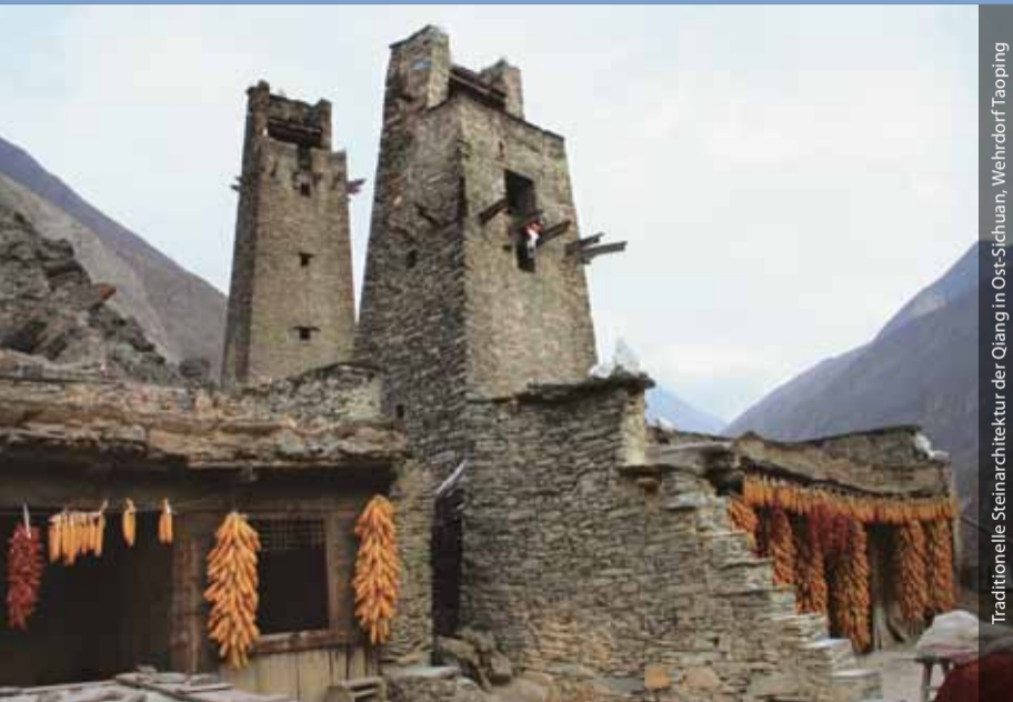
Traditionelle Steinarchitektur der Qiang in Ost-Sichuan, Wehrdorf Taoping

Mit der Gründung der Außenstelle Peking im November 2009 verfolgt das DAI das Ziel, die langjährige Zusammenarbeit mit chinesischen Archäologen zu vertiefen und auszuweiten. Sie dient dem Studium der Alten Kultur und Geschichte Chinas durch Wissenschaftler beider Länder.