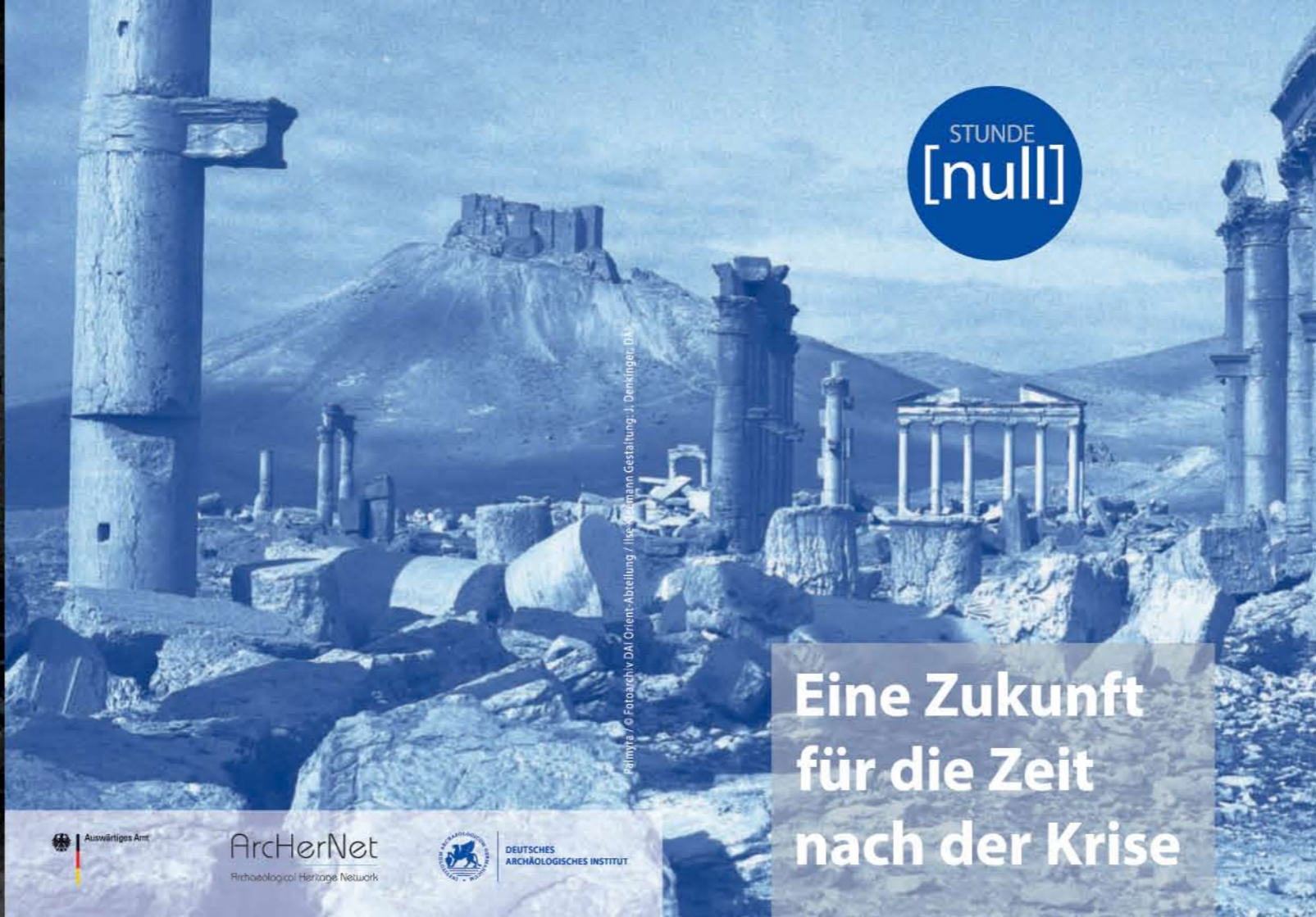
Palmyra / © Fotoarchiv DAI Orient-Abteilung / Ilse Künemann Gestaltung: J. Denkinge, DAI