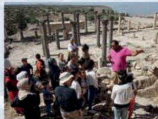
Programm „Train the Trainers“ Tandem-Führung zur Vermittlung des kulturellen Erbes in Umm Qais (Jordanien)

Das Deutsche Archäologische Institut als eine der größten archäologischen Forschungseinrichtungen weltweit richtet sein Handeln nach faktischen Prioritäten aus, nicht nach symbolischen. Um dabei Kompetenzen bündeln und Synergieeffekte schaffen zu können, entstand die Idee zum Projekt „Die Stunde Null – Eine Zukunft für die Zeit nach der Krise“. So haben wir das Vorhaben gemeinsam mit Partnern des „Archaeological Heritage Network“ (ArcHerNet), der Abteilung für Kultur und Kommunikation des Auswärtigen Amtes sowie der Gesellschaft für Internationale Zusammenarbeit (GIZ) ins Leben gerufen. Die Sondermittel „Flucht und Migration“ des Auswärtigen Amtes durch Unterstützung des Deutschen Bundestages tragen dazu bei, das Projekt in den nächsten Jahren umzusetzen.