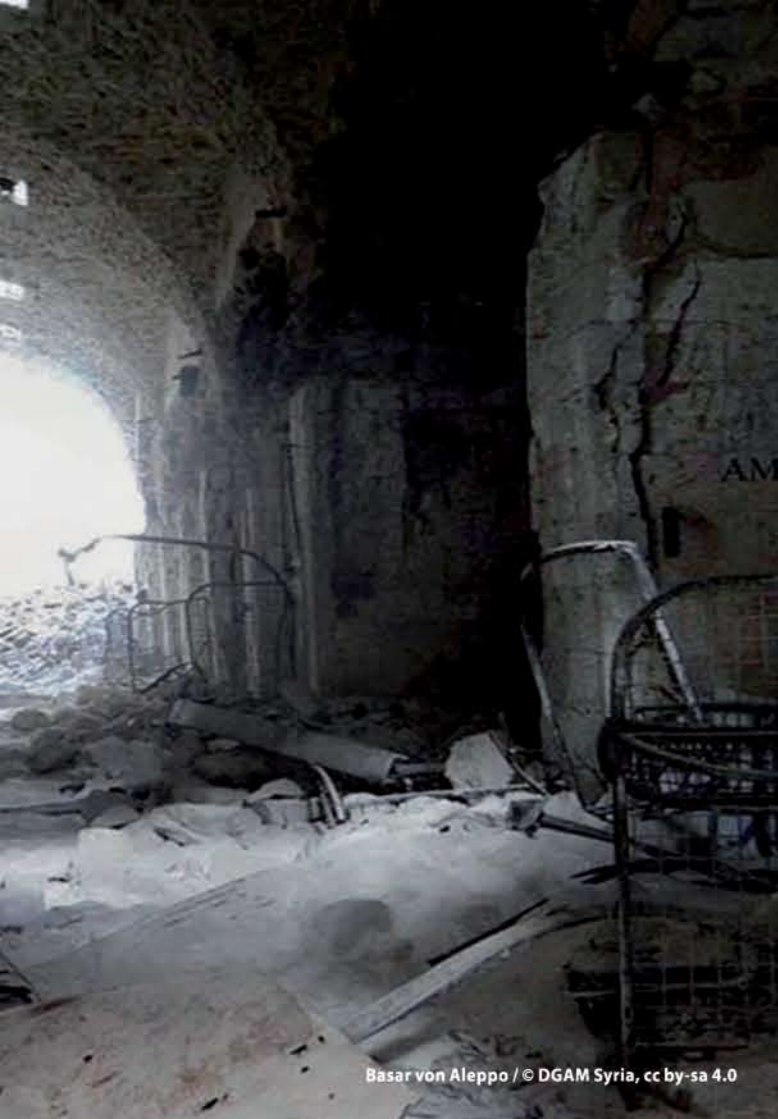
Basar von Aleppo