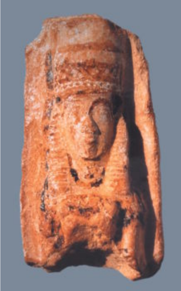
Milet. Arkaik terrakotta