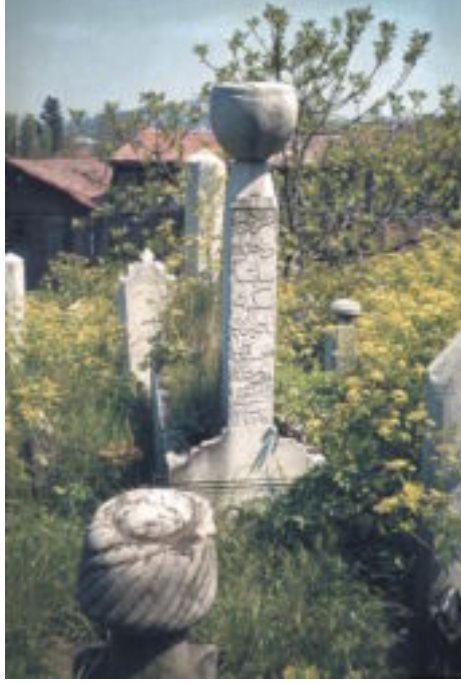
Istanbul. Sekbanbaşı mezarı, Eyüp