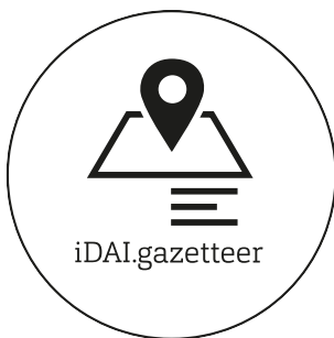
Heraion von Samos

Die Forschungsergebnisse werden laufend u. a. in der Samos-Reihe veröffentlicht. Daneben fungieren bis heute die DAI-Zeitschriftenreihen Athenische Mitteilungen und Archäologischer Anzeiger als wichtigste Publikationsorgane.